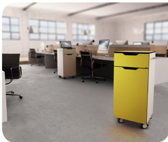
DURABLE QUADRO® Multi Trolley

A bútorok, mint színfoltok? “Nem szükséges egy egész falat használni. Kisebb bútorok szintén használhatók a megfelelő szín kombinációk eléréséhez. Ideális esetben ezek mobilak, és többféleképpen használhatók, így megfelelhetnek a modern irodák