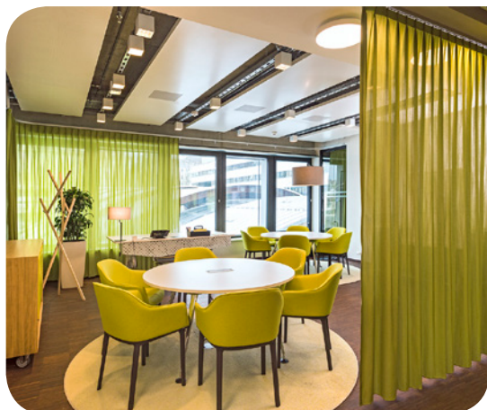
Welle 7 in Bern