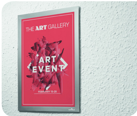
DURABLE DURAFRAME® WALLPAPER

A piros több figyelmet, a zöld több harmóniát biztosít. A színek pszichológiai tanulmányainak segítségével erősíthetjük ezen hatásokat. Ez nem azt jelenti, hogy a teljes falat le kell festeni. Elegendő például a feliratokat, információs anyagokat különböző színekkel beépíteni a designba, és a DURABLE DURAFRAME® infokereteinek segítségével kihelyezni őket.