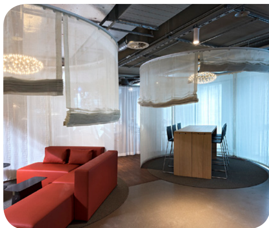
Welle 7 in Bern, © Création Baumann

A svájci textil cég Création Baumann tervezői megteremtették a fény, hely, design és szín összhangját, melyben a színek kiemelt szerepet kaptak. A zöld, kék és piros színvilág már a tervezés korai stádiumában kiválasztódott.