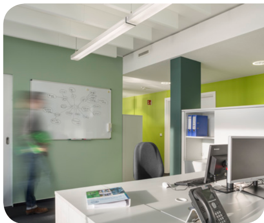
DAW SE, © Caparol