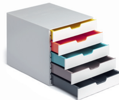
DURABLE VARICOLOR® MIX

csak rugalmasan használhatónak kell lenniük, de vizuálisan is illeszkedniük kell ezekbe a terekbe. A letisztult design világával és sokrétű használhatóságával az új VARICOLOR® MIX fiókos irattárolók a DURABLE-től jó példát adnak arra, hogy kombinálhatjuk a trendi színeket egyben színregiszteres funkcióval.